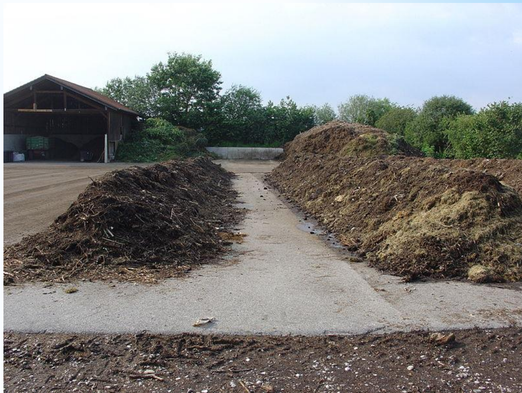
Kompost – přirozené hnojivo (části rostlin, plevel, kuchyňské odpadky, vápno)