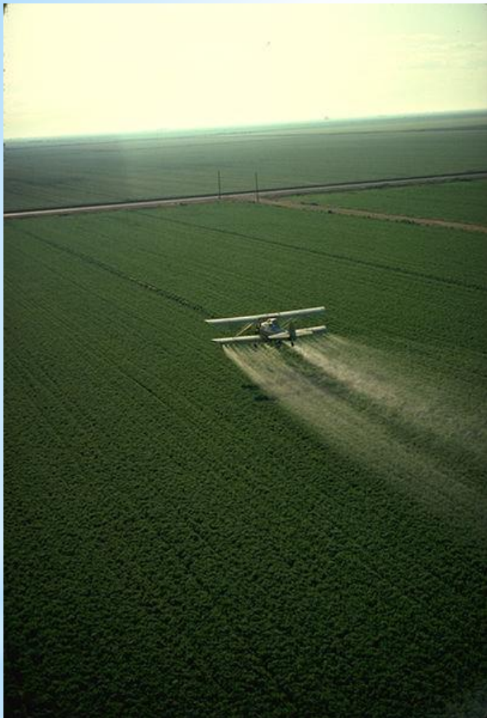
Umělá hnojiva - pesticidy